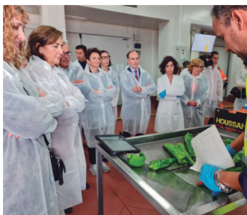
Visita ayer al PCF del Puerto Bahía de Algeciras.

Las "exitosas" mejoras en el PCF de Algeciras serán extendidas al resto de PCFs