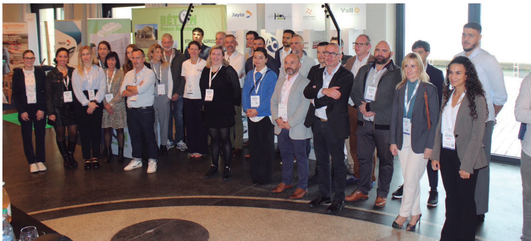
Foto de familia de los representantes de las empresas expositoras en la séptima edición de la Bolsa Agroalimentaria Agri'Vrac, celebrada este jueves en Anglet.