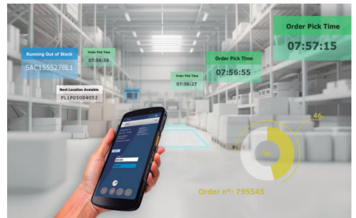
Alier es el software desarrollado por Aliernet.

Por otro lado, la compañía tiene en mente expandirse de forma clara a Latinoamérica durante el año 2025. Actual-