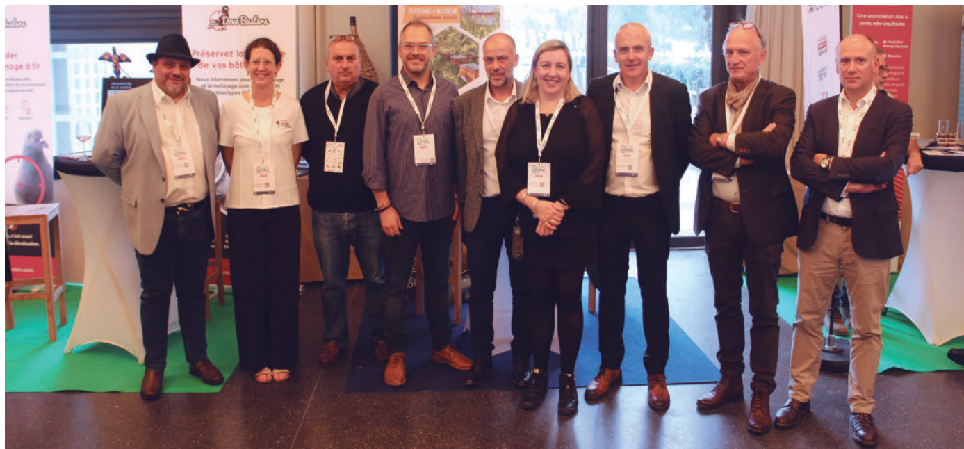
Representantes del Puerto de Baiona y de puertos de la Región de Nueva Aquitania en Agri'Vrac.

Agri'Vrac arrancó ayer en el l'Espace de l'Océan de Anglet, entre Baiona y Biarritz, con la Bolsa de Cereales Agri'Vrac 2024 en la zona de stands. Un al-