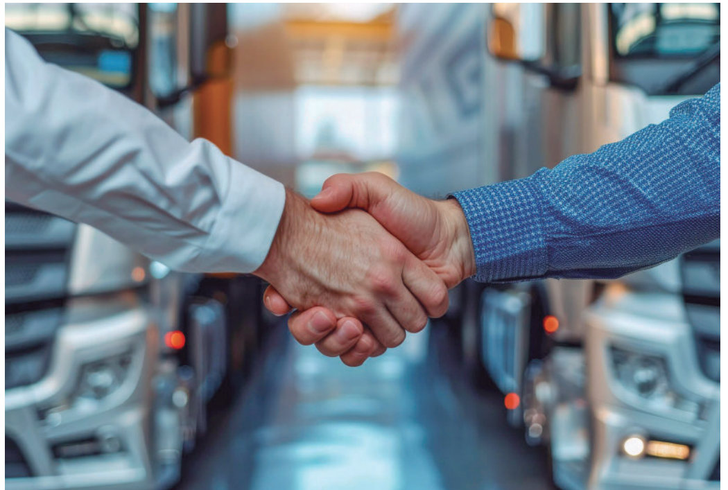
La asesoría jurídica radica en su capacidad para identificar y gestionar las múltiples contingencias del sector.

La formación continua sobre novedades normativas es también crucial para garantizar que las empresas estén bien informadas y preparadas para los cambios. "Resulta de vital importancia el que, ya sea una empresa o bien un profesional persona física, cuente con un buen asesoramiento, especialmente para aquellos que operan en sectores sometidos a fuerte regulación, como es el sector del comercio exterior que, a mayor abundamiento, se encuentra en constante evolución/cambio impulsado por factores geopolíticos, medioambientales, avances tecnológicos e inestabilidad